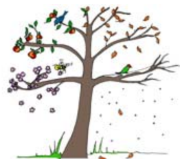
Im Landesverband und extern