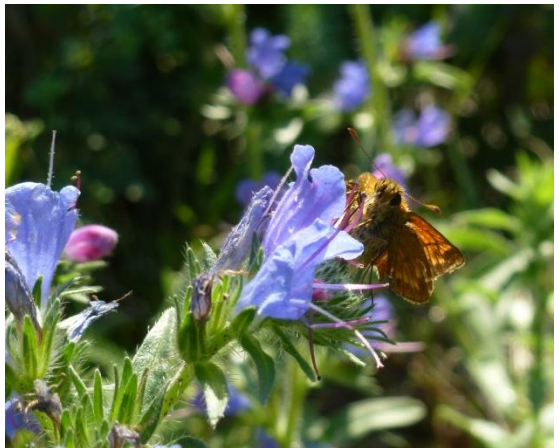
Von oben: C- Falter, Kaisermantel, Dickkopffalter