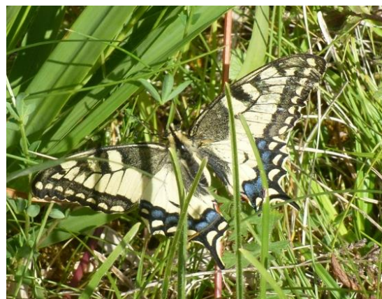
Von oben: Schachbrettfalter, Zitronenfalter, Schwalbenschwanz